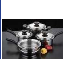
使い込むほどに実感する、 その「違い」を支えるのは技術力の結晶 ヨシノクラフト鍋シリーズ