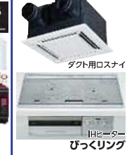
タクト用ロスナイ