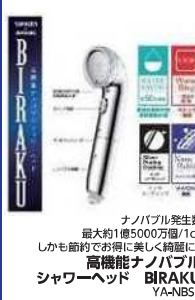
ナノバブル発生数 最大約1億5000万個/1cc しかも節約でお得に楽しくお風呂に。 高性能ナノバブル シャワーヘッド BIRAKU YA-NB55