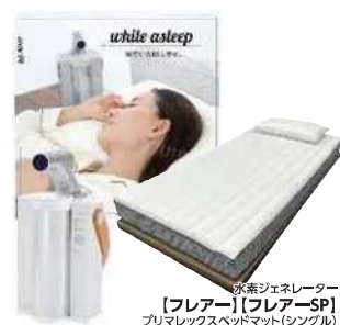
氷室ジェネレーター 【フレアー】【フレアーSP】 プレミアムレスベッドマット(シングル)