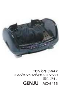
コンパクト3WAY マサジメントメディカルマシンの 誕生です。 GENJU MD-8415