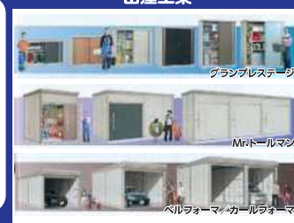
グループレストラン