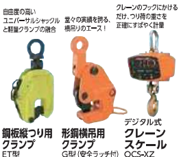
鋼板縦つり用 クランプ ET型