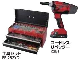
コードレス リベッター R2B1