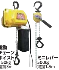
電動 チェーン ホイスト 150kg 揚程3m