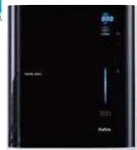
ウォーターヘルスケアという、新習慣! トリムイオン リファイン