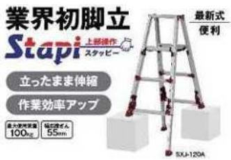
業界初脚立 Stapi ステップ