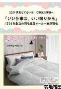
2024東北とてらひ こだわりの寝床へ 『いい仕事は、いい寝りから』 1954年創立の羽毛道具メーカー東洋羽毛 羽毛布団