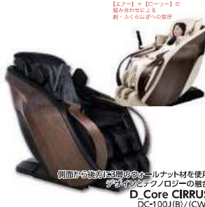
【ロー】 + 【ハイ】の 組み合わせによる 新・ふくらみさへへの進化