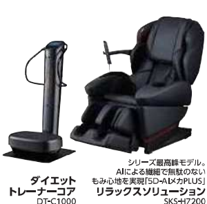
ダイエット トレーナーコア DT-C1000