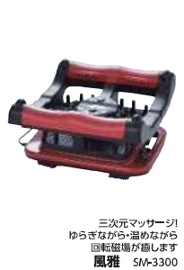
三次元マッサージ ゆらぎながら温めながら 回転磁場が溜ります 風雅 SM-3300