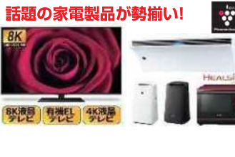
話題の家電製品が勢揃い!