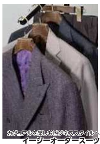
カシミアを主とした高品質な素材へ イージーオーダースーツ