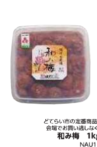
どてら市の定番商品。 会場で買い逃しなく! 和み梅 1kg NAU1K