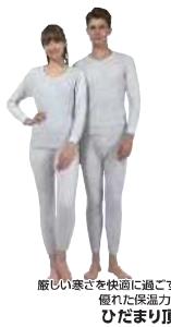
厳しい寒さを快適に過ごす 優れた保温力。 ひだまり頂