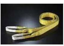
Zタイプ JIS最上級等級(4等級)の 強力ベルトスリング